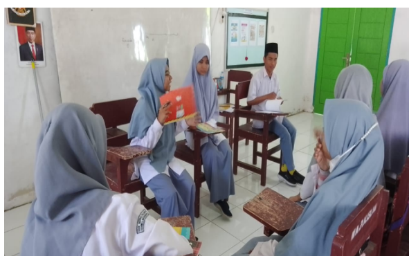
Gambar 1. Proses Perencanaan Pembelajaran Bersama Peserta Didik

Upaya guru dalam memastikan agar target capaian tiap pertemuan dapat semaksimal mungkin, maka guru dan peserta didik perlu menentukan jadwal pelaksanaan kegiatan pembelajaran beserta kerangka dan aturan dalam mengembangkan produk yang dihasilkan. Keterlibatan peserta didik pada setiap tahapan dalam proses pembelajaran dimaksudkan agar membuat peserta didik mengetahui dengan pasti tujuan dari pembelajaran yang dilakukan.