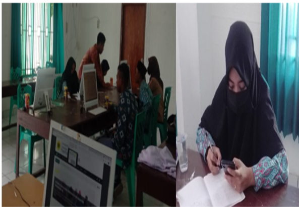
Gambar 2. Proses Literasi Informasi Peserta Didik

Dalam proses menumbuhkan budaya literasi, guru tidak boleh membatasi peserta didik dalam mencari informasi. Dengan membatasi peserta didik maka guru secara tidak langsung dapat mempengaruhi motivasi dan minat peserta didik dalam mengikuti proses pembelajaran (Nurhalita & Hubaidah, 2021). Hal ini tentu sesuai kondisi pada pembelajaran Abad ke-21 yang memberikan kesempatan kepada peserta didik untuk dapat secara mandiri meningkatkan berbagai keterampilan salah satunya terkait kemampuan literasi. Perbedaan informasi antara peserta didik menjadi poin penting bagi guru untuk meningkatkan kemampuan berpikir kritis dan kreatif peserta didik.