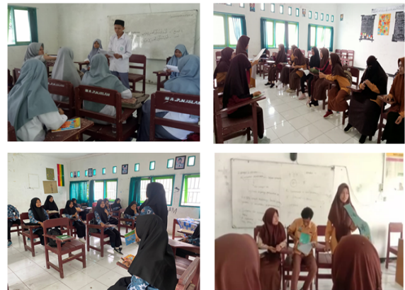
Gambar 3. Proses Presentasi Produk Mind Mapping di depan Kelas

Tahap ini memfasilitasi peserta didik untuk mempertanggungjawabkan hasil kinerjanya di depan teman sebaya melalui proses presentasi. Guru perlu memfasilitasi hal ini karena tentunya setiap peserta didik memiliki referensi atau sumber dalam mencari informasi yang berbeda-beda. Perbedaan informasi tersebut perlu diklarifikasi kebenarannya oleh guru sehingga peserta didik lainnya akan mendapatkan informasi yang valid.